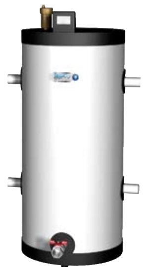
Der elector®-M25 ist die perfekte Ergänzung für den nachhaltigen Korrosionsschutz zu einer Systemreinigung mit OXILIN-P20 für Anlagen bis 5 m³.

Die Kombination von OXILIN-P20 mit einem elector-Korrosionsschutzgerät führt zu einem wesentlich schnelleren Sanierungserfolg. Im Normalfall ist die Heizungsanlage bereits nach drei bis sechs Monaten von allen Verunreinigungen befreit. Durch das elector-Gerät ist ein nachhaltiger Korrosionsschutz gegeben, wodurch keine weiteren Verschlämmungen mehr auftreten und der Werterhalt der Heizung auf umweltfreundliche Art und Weise gesichert ist.