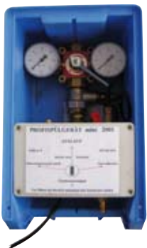
Heizungsspülung mit dem Spülgerät mini 2001 und OXILIN-P20 – einfach und effektiv!

Zunächst wird das Produkt in die Heizungsanlage gegeben. Die Dosierhöhe von OXILIN-P20 berechnet sich nach dem Wasserinhalt der Heizungsanlage und sollte für die Systemreinigung 1000 bis 5000 ppm (0,1 - 0,5%) von Anlagenvolumen betragen.